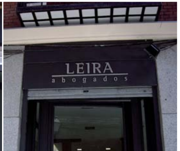
3. Letra Corpórea iluminada con focos