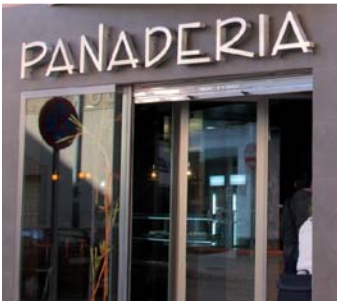
1. Letra Corpórea retroiluminada