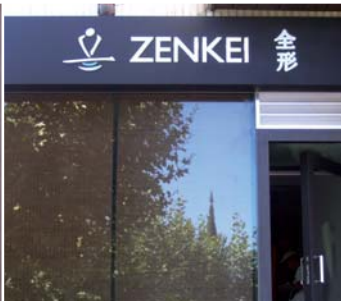
2. Cajón de luz de letra calada